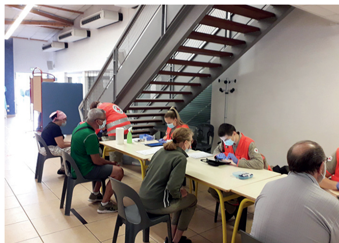
Avion - 26 juin